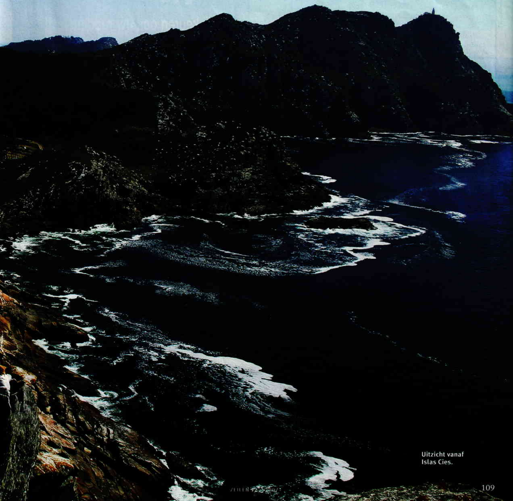
Uitzicht vanaf Islas Cies.

Met een paella-avond vieren we ons afscheid van Spanje. Een beetje met weemoed, want we hebben bijna een maand in dit mooie gebied mogen rondvaren. Nou ja, Oporto lokt ook. Z